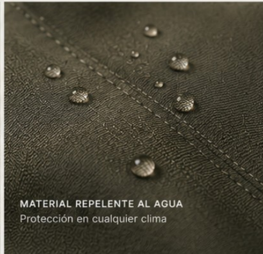
MATERIAL REPELENTE AL AGUA Protección en cualquier clima