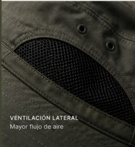
VENTILACIÓN LATERAL Mayor flujo de aire